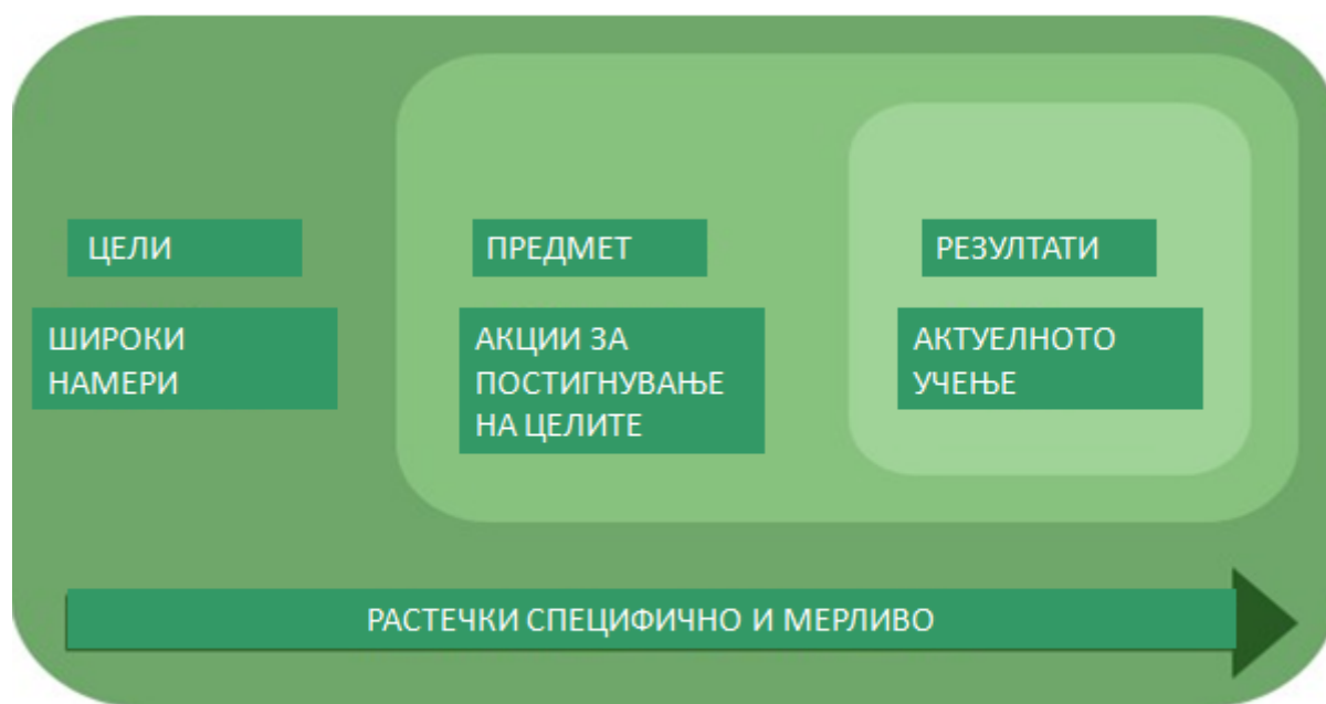
Слика 2.1.1 Цели, предмети и резултати

Слика 2.1.1 подолу е краток преглед на разликите помеѓу овие три клучни поими. Тие исто така откриваат различни теории за учење. На пример, пристапот предводен од целите го гледа учењето главно во смисла на забележливи, мерливи однесувања. Дури и меѓу академиците и наставниците има различни дефиниции и употреба на овие поими.